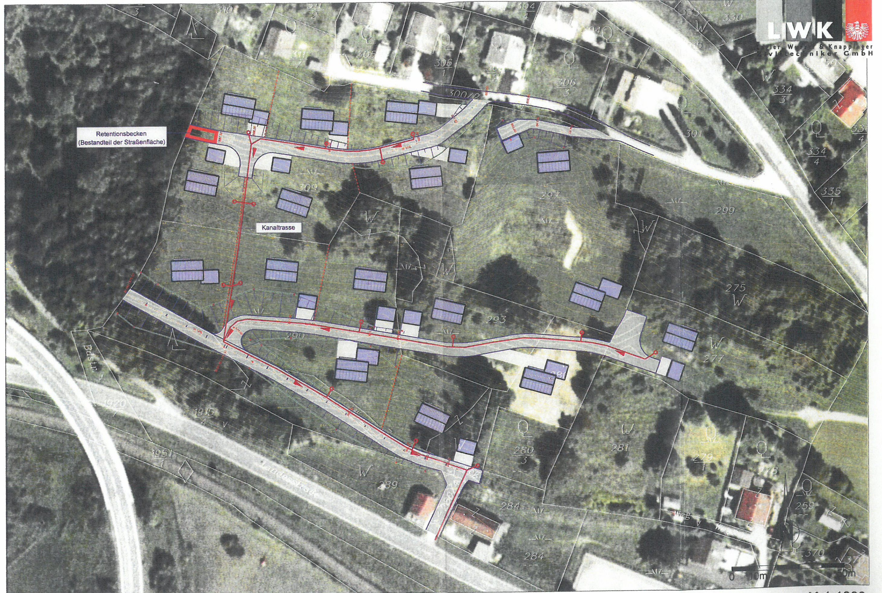
KANALTRASSE "NÖTSCHER HÜGEL-WEST"