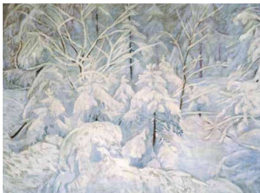
Sebastian ISEPP, Waldinneres im Winter I, 1909-10, Öl-Leinwand, Privatbesitz