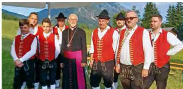
Firmung St. Georgen