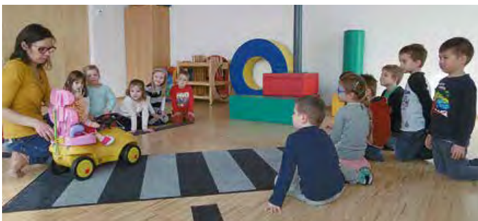
Bei einer ÖAMTC – Verkehrserziehung wurden die Kinder über das richtige Verhalten im Straßenverkehr aufgeklärt.